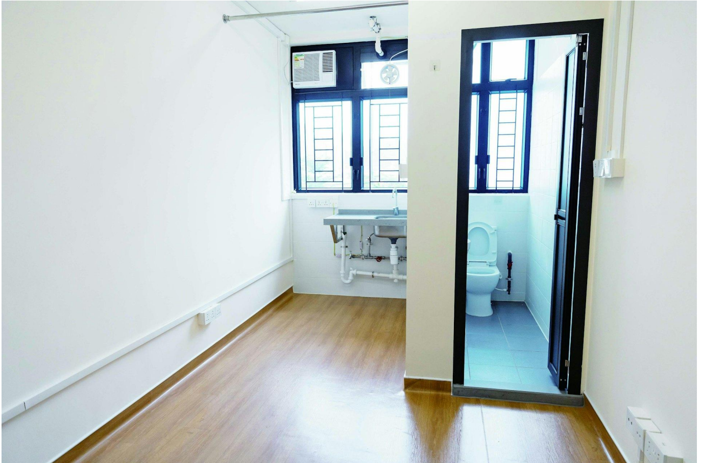
過渡性房屋「仁濟軒」的單位間隔分明。