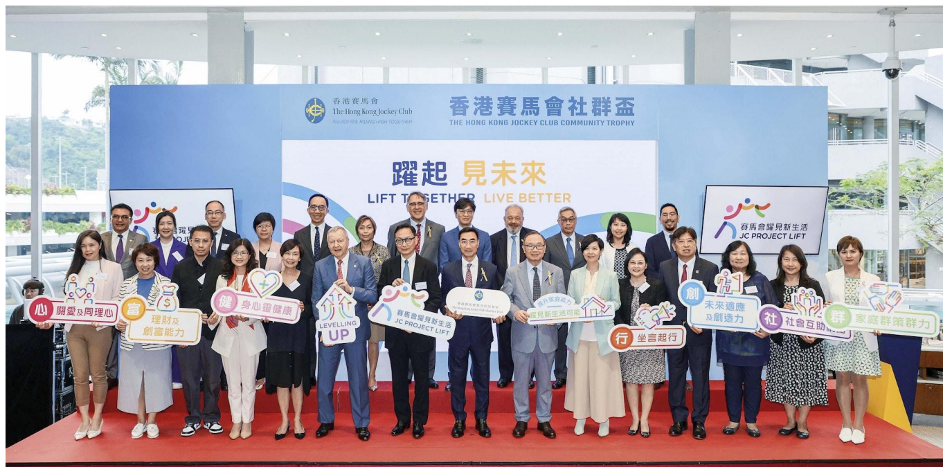
何永賢早前出席「賽馬會躍見新生活」計劃公佈儀式，與馬會主席利子厚（前排右八）、馬會副主席廖長江（前排右七）、馬會行政總裁應家柏（前排左六）及嘉賓等合照。